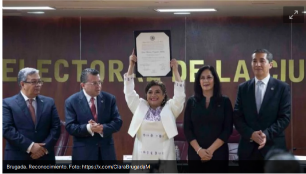
Brugada. Reconocimiento.