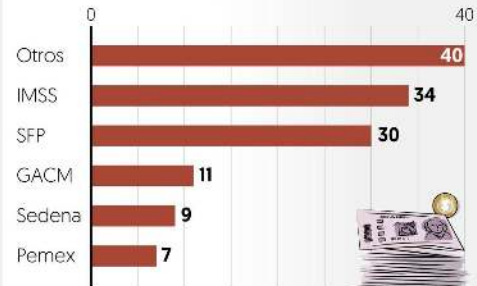
Gráfico: Esmeralda Ordaz

■ Número de empresas multadas por institución a septiembre de 2019