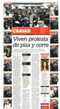
■ Circe Camacho.