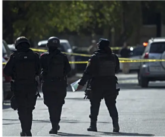
Reportan asesinato de modelo e influencer, conocida como la "Barbie Regia", en Monterrey