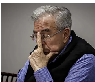
"¿Y el Rocha?": ciudadanos trolean al gobernador de Sinaloa en un vuelo