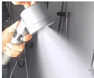
This Shower Head Keeps Selling Out At Costco (Find Out Why) Shower Drive