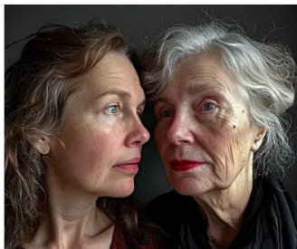
Costco Shoppers Say This Wrinkle Cream Is "Actually Worth It" The Skincare Magazine