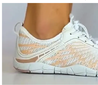
These Barefoot Shoes are Leaving Neuropathy Experts Baffled Barefoot Vitality