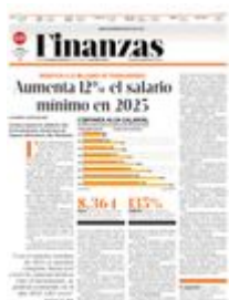
Gráfico: Daniel Rey