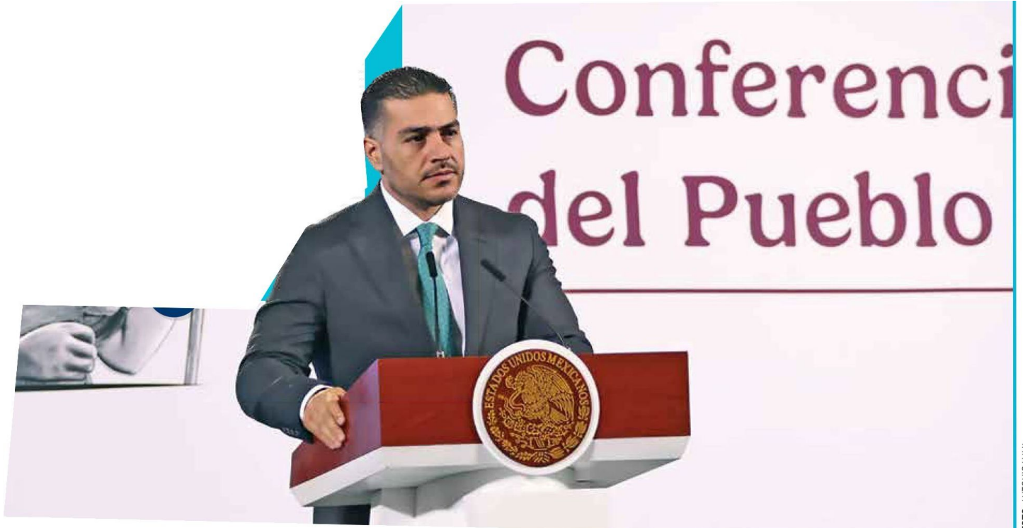
LEY. Omar García Harfuch presentó los resultados en seguridad durante los dos primeros meses de la actual administración encabezada por Claudia Sheinbaum.