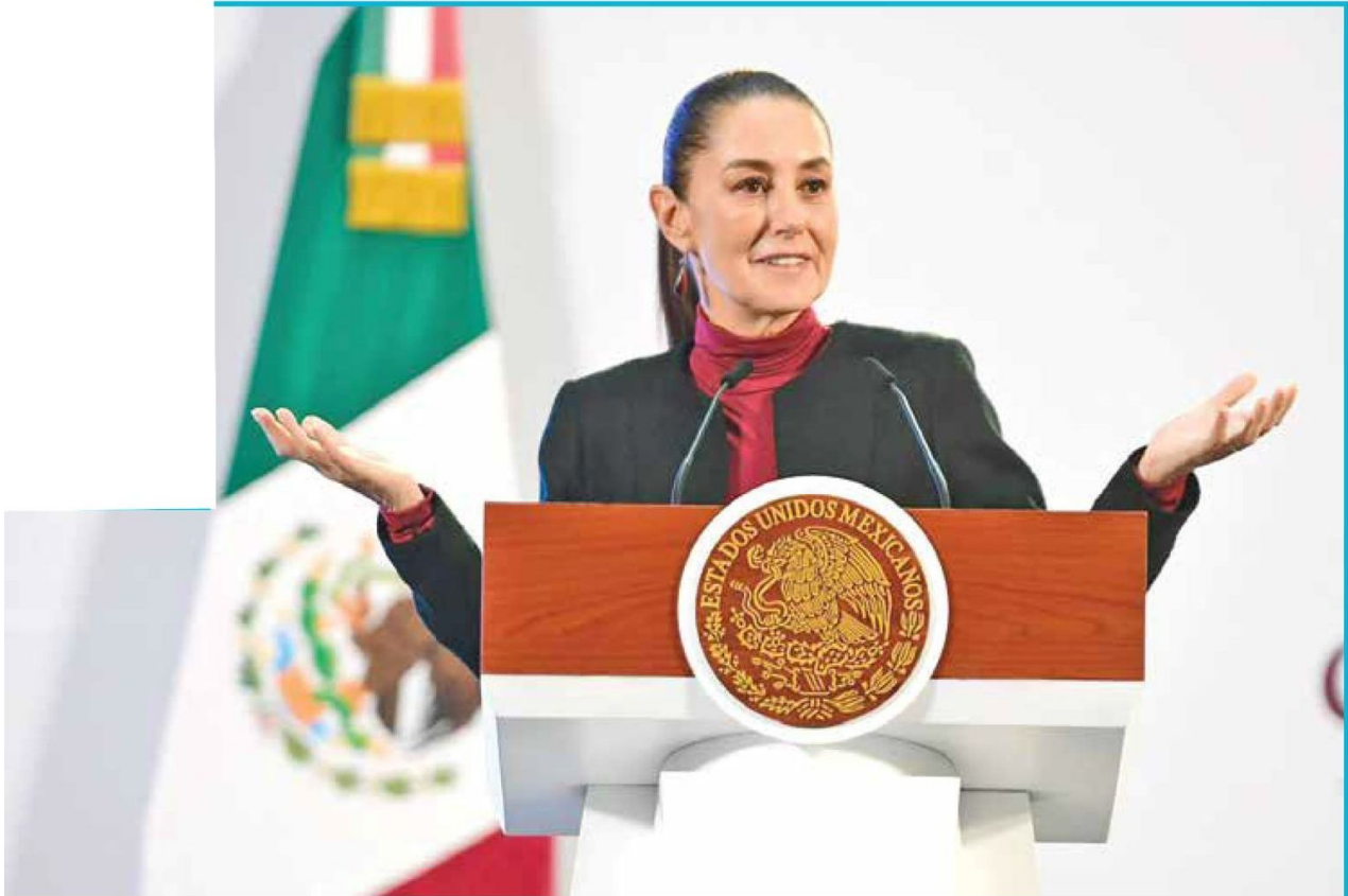
• LEY. La presidenta Claudia Sheinbaum aseguró que con el proyecto en la Corte se estaría cometiendo una falta constitucional.