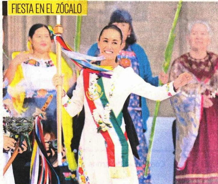
La Presidenta recibió el bastón de mando a nombre de 113 mujeres de las 70 etnias del país, el cual representa el poder comunal.