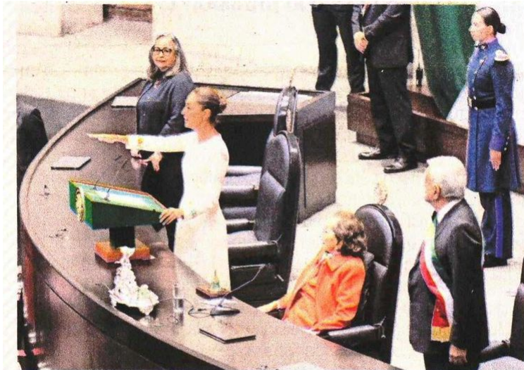
Sheinbaum estuvo acompañada de la presidenta de la Corte, Norma Piña, y de la presidenta del Congreso, Ifigenia Martínez.

El de ayer fue un día histórico y simbólico, con las tres protagonistas del Ejecutivo, Legislativo y Judicial juntas en la toma de posesión.