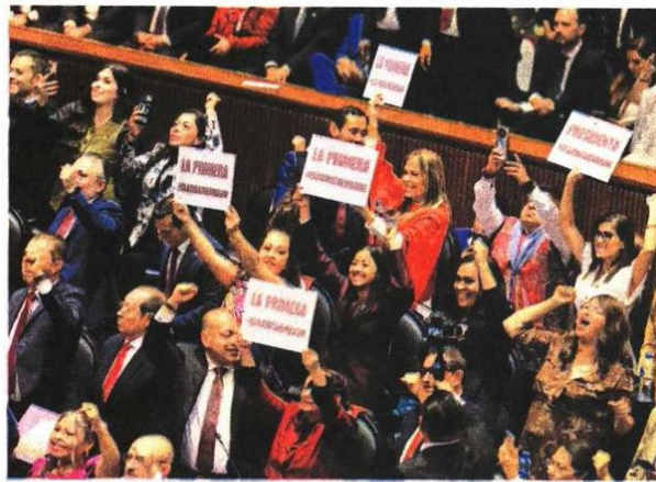
Algunas legisladoras celebraron el hecho de que una mujer haya alcanzado la primera magistratura del país.

La cobertura de la sesión estuvo a cargo de más de mil periodistas de 400 medios de comunicación tanto nacionales como extranjeros, que abarrotaron los espacios disponibles para la prensa dentro de la Cámara de Diputados. ●