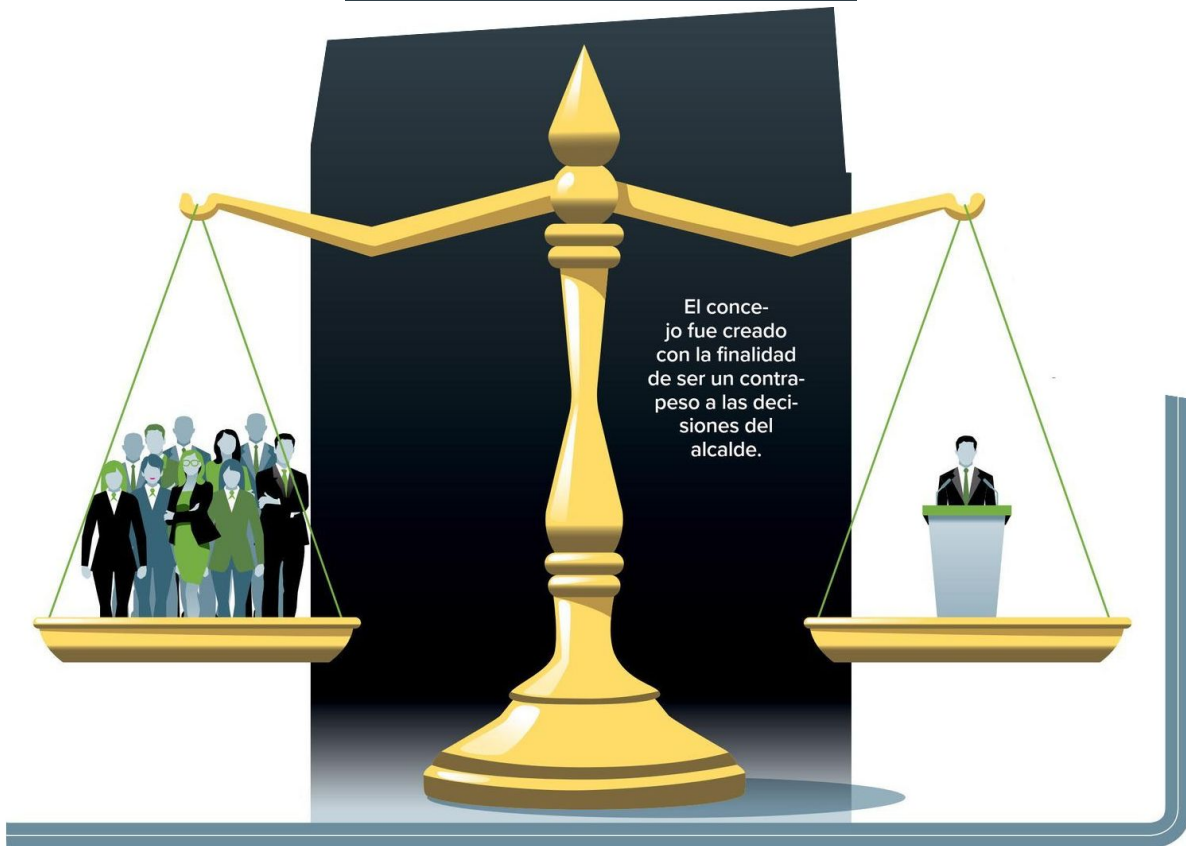
Ilustración: Abraham Cruz

Otro planteamiento que tienen es que su salario se equipare al de un regidor en los municipios; es decir, que pase de 28 mil a 40 mil pesos.