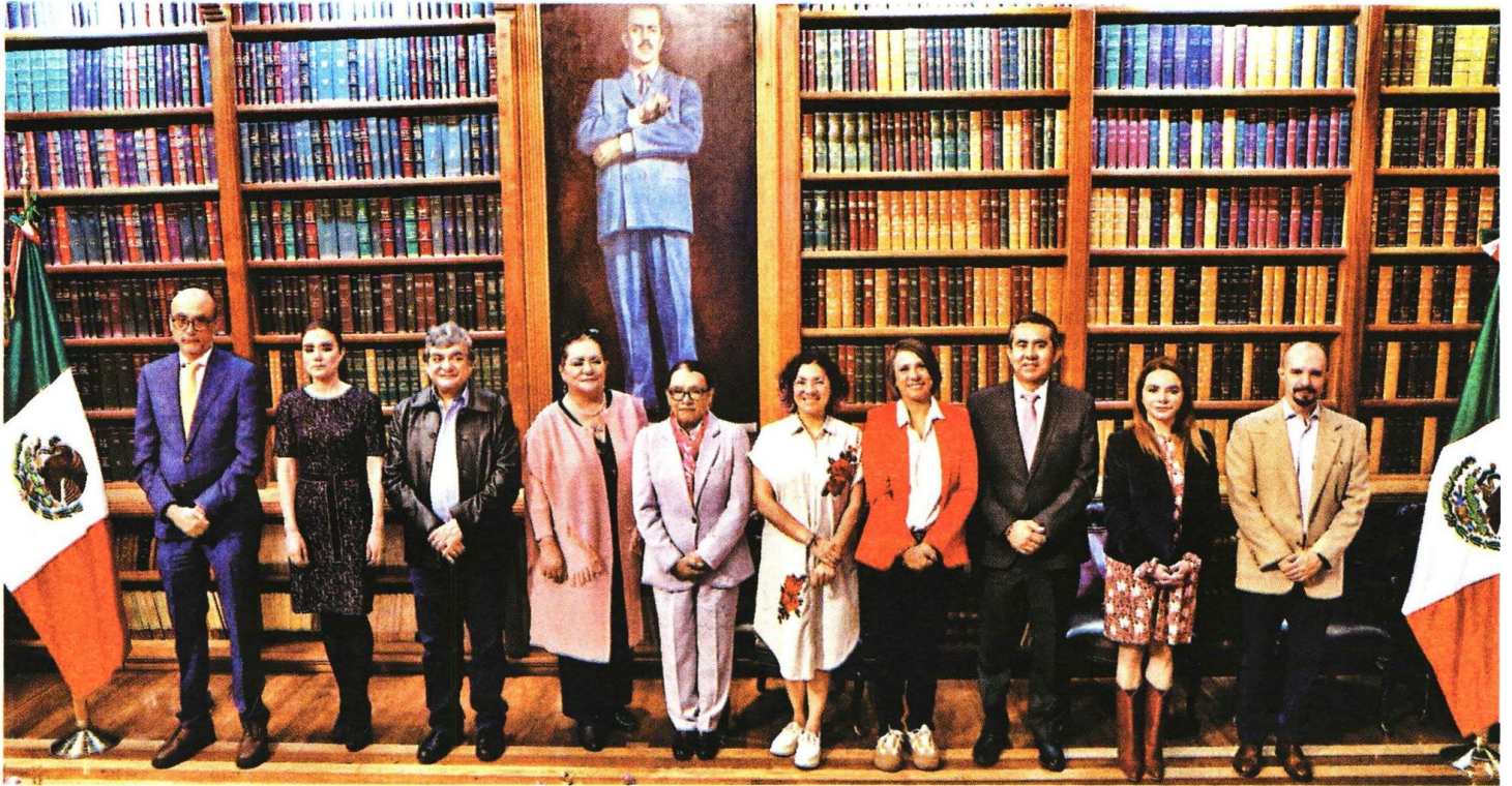
Integrantes del Consejo General visitaron a la secretaria de Gobernación para “fortalecer la coordinación institucional”.