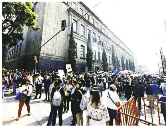
Personal de la SCJN no ha suspendido labores como la mayoría de los integrantes del Poder Judicial.