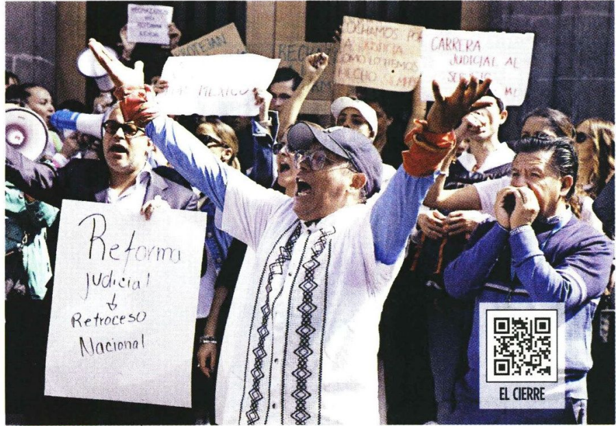
OBJECCIÓN. Empleados de la Suprema Corte bloquearon todos los accesos a la sede central en protesta por la reforma judicial.

Si los inconformes radicalizan su postura e impiden el paso totalmente, la Corte tendría que sesionar por video conferencia, como hizo durante la pandemia por Covid-19.