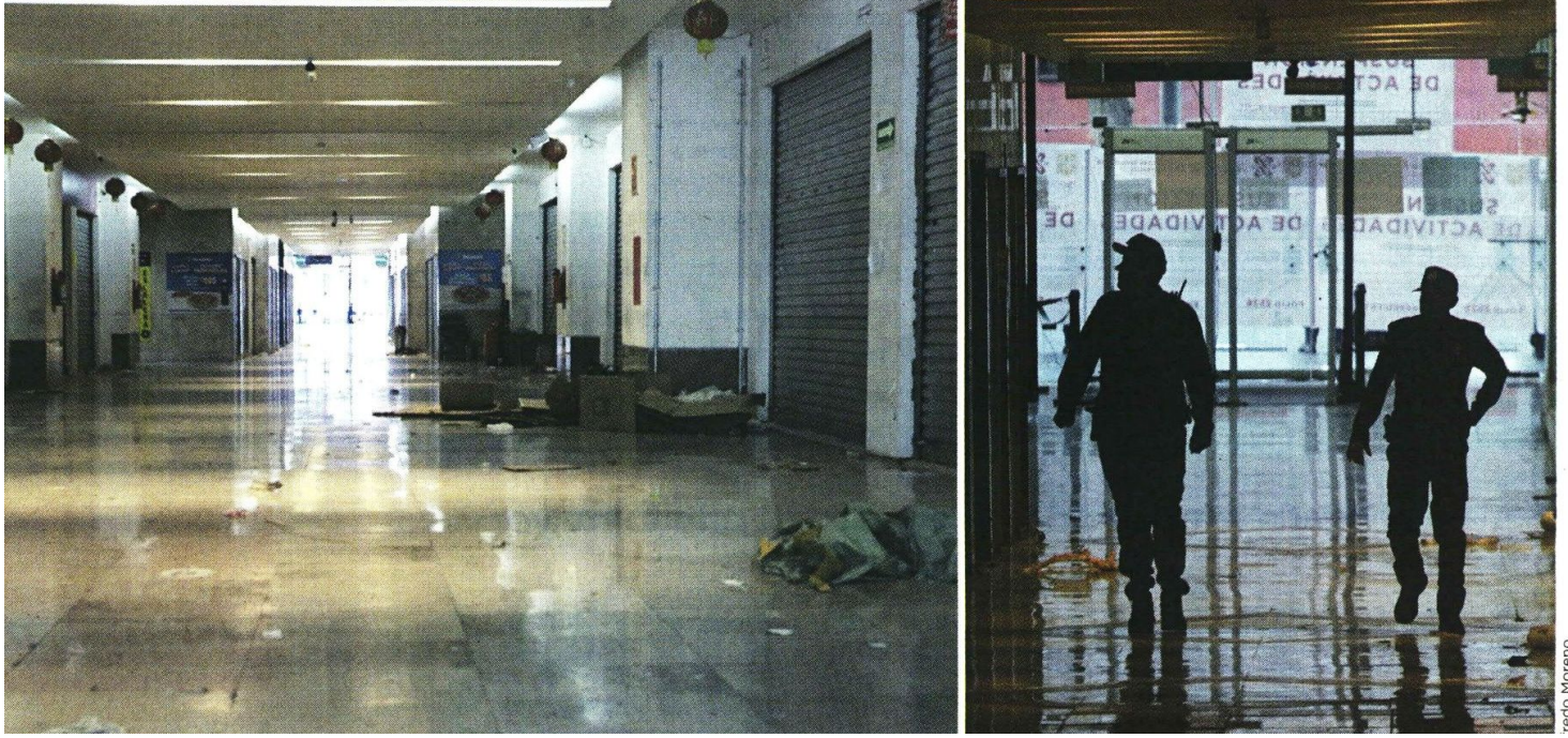
DESIERTO. Los pasillos, que previo a Navidad lucían abarrotados, quedaron en completo abandono tras el operativo orquestado por autoridades federales