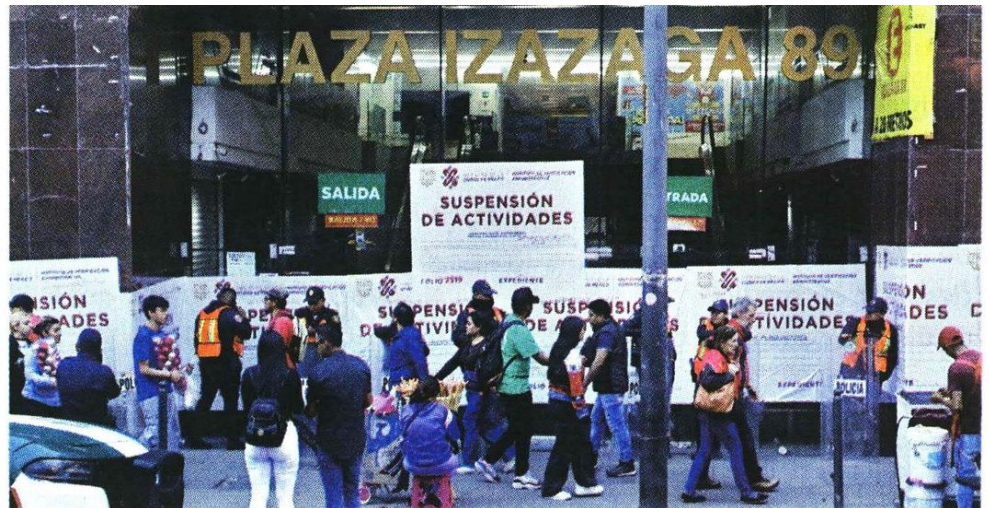
El golpe contra la piratería se dio en una de las épocas del año con mayores ventas.

Una mujer que cargaba cajas con adornos para cabello preveía sumarse a la informalidad. Planeaba poner un puesto en la explanada del Metro Pino Suárez.