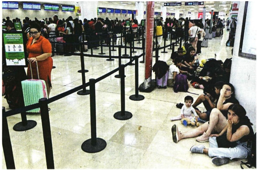
LARGA ESPERA. En el Aeropuerto Internacional de Cancún, cientos de turistas buscaban ayer tomar un vuelo para salir del destino turístico.