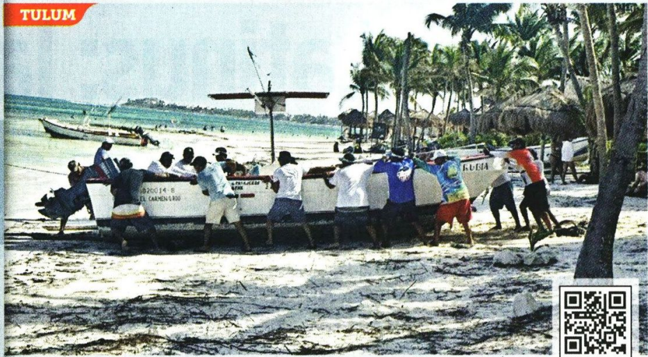
■ Pescadores se apoyaron ayer para sacar sus embarcaciones del mar, a fin de ponerlas bajo resguardo, ante el inminente impacto del huracán.

fueron declarados en alerta naranja (peligro alto), entre ellos: Tulum, Felipe Carrillo Puerto, Bacalar, Othón P. Blanco y José María Morelos.