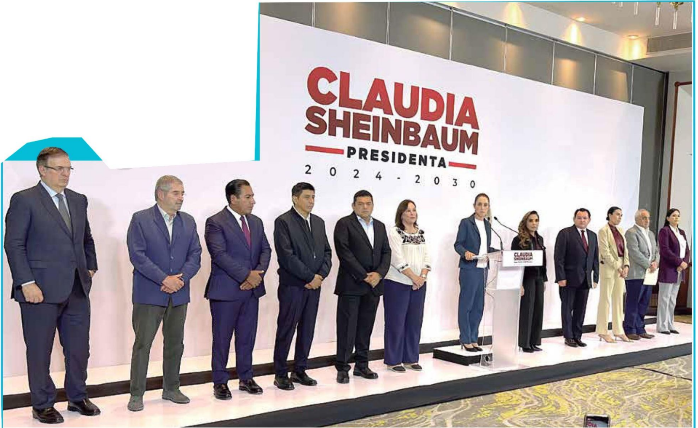
CONTINUIDAD | • La virtual Presidenta recordó que AMLO decidió impulsar la región sureste del país y hacerlo receptor de la mayor inversión.