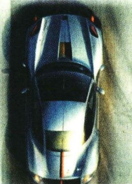
Ilustración: IA Grupo REFORMA

■ El proyecto será discutido hasta el próximo martes .