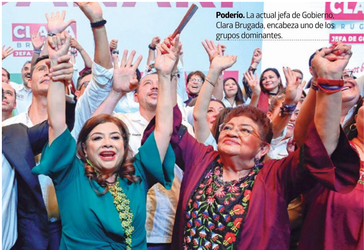
Poderío. La actual jefa de Gobierno, Clara Brugada, encabeza uno de los grupos dominantes.