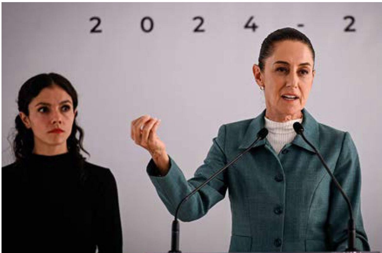
MENSAJE. La virtual presidenta, Claudia Sheinbaum, ayer.