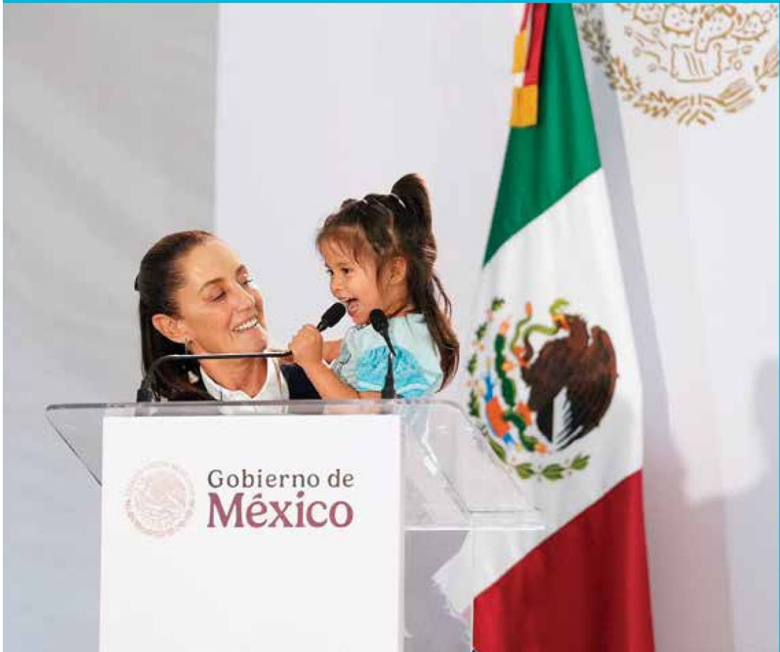
SONRISAS. Es tiempo de las niñas y las mujeres, destacó Claudia Sheinbaum durante su visita a San Luis Potosí.