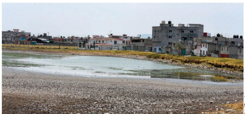
UNA de las tres lagunas del Parque Sierra Morelos, en Toluca, se encuentra casi seca.