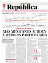
Gráfico: Rodolfo Gómez García