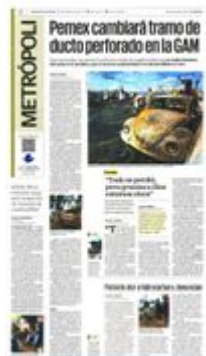
Afectados por el incendio de este lunes aseguran que días antes se percibía olor a combustible.