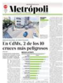
Gráfico: Daniel Rey