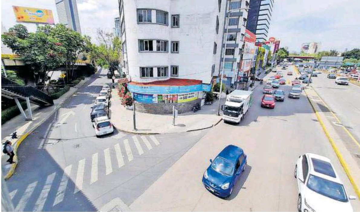
En el cruce de Circuito Interior con Bahía de la Ascensión los vehículos superan los 50 km/h