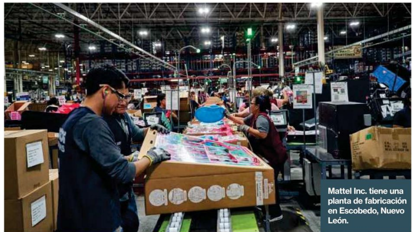
Mattel Inc. tiene una planta de fabricación en Escobedo, Nuevo León.

El acceso a la electricidad es una de las principales preocupaciones de los propietarios de inmuebles industriales. López Obrador modificó las regulaciones para consolidar el control estatal de la industria energética, deteniendo las subastas públicas para la generación de electricidad y limitando la participación del sector privado. La capacidad de transmisión y distribución del país no ha seguido el ritmo de la demanda, especialmente en el norte, lo que ha llevado a algunas partes del país a sufrir apagones estacionales generalizados. La burocracia a menudo significa que los parques