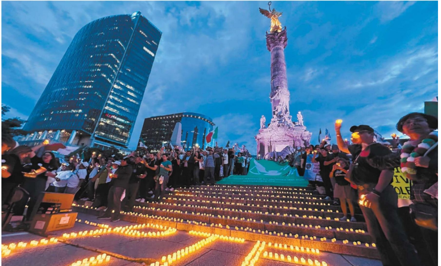
Con velas y la figura de la justicia, trabajadores del Poder Judicial e integrantes de la sociedad civil protestaron en las escalinatas del Ángel de la Independencia.