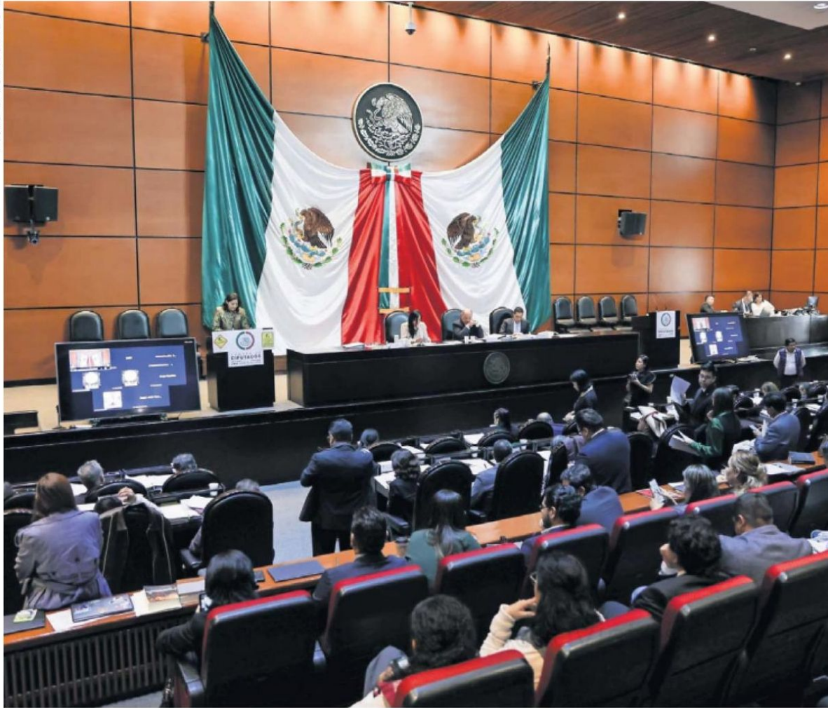
Diputados de Morena y aliados del PT y PVEM sacaron con presiones el dictamen de la reforma al Poder Judicial en la Comisión de Puntos Constitucionales de la Cámara Baja, para pasarlo al pleno en la 66 Legislatura.