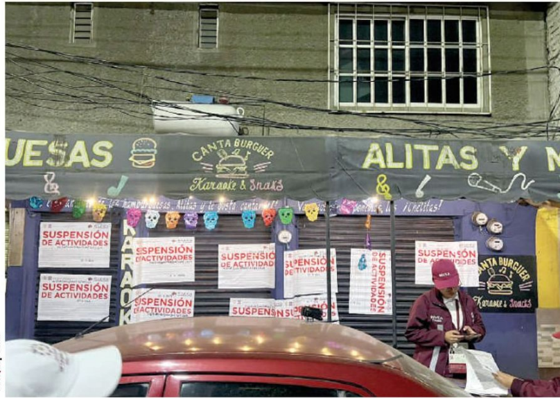
IZTAPALAPA sancionó negocios por venta ilegal de alcohol el fin de semana.