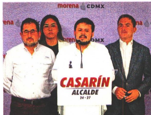
La sede distrital 30 fue resguardada por la Guardia Nacional; al recuento de votos en el Distrito 12 acudió Rojo de la Vega, y Morena impugnará elección en Cuauhtémoc.