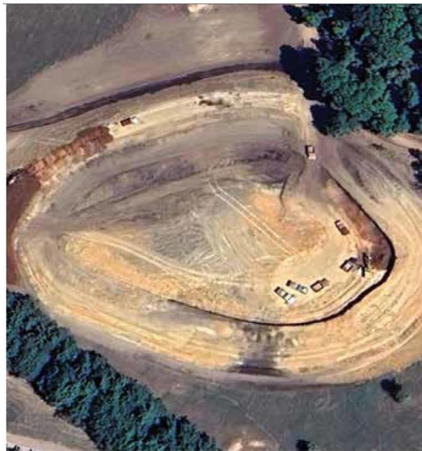
A través de imágenes satelitales se localizaron cuerpos de agua sin autorización; también fue ubi cada la construcción de uno muy grande.