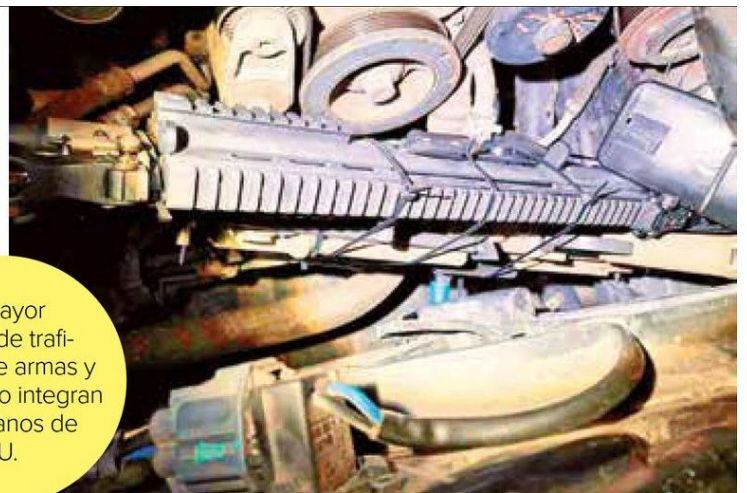
El mayor grupo de traficantes de armas y fentanilo lo integran ciudadanos de EU.